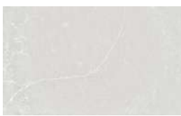
Desert Silver (PG3)